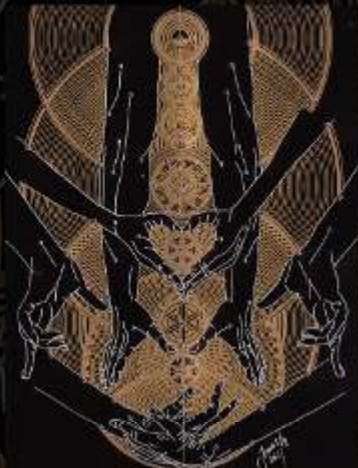
Manus Milacolorum 6