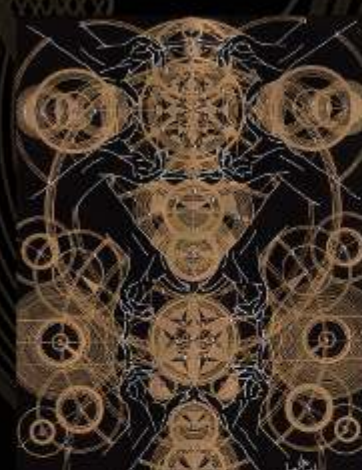
Manus Milacolorum 7