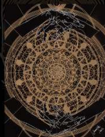
Manus Milacolorum 11