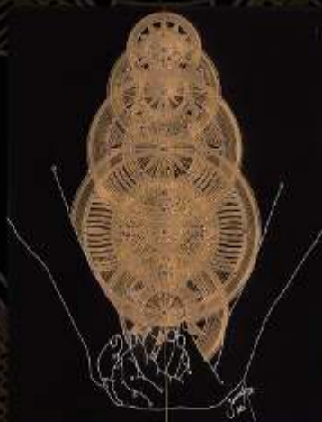
Manus Milacolorum 5