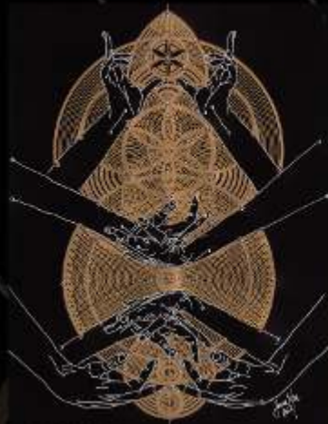
Manus Milacolorum 1