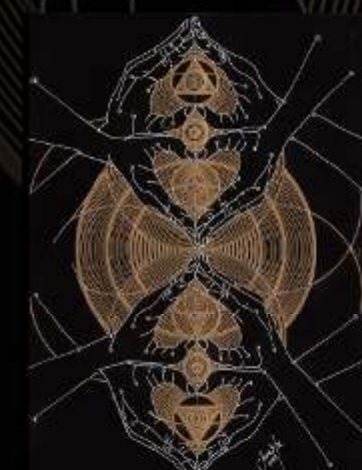
Manus Milacolorum 10