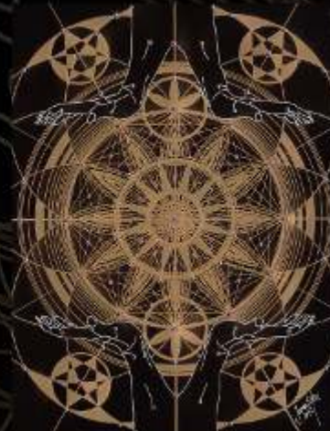
Manus Milaculorum 15