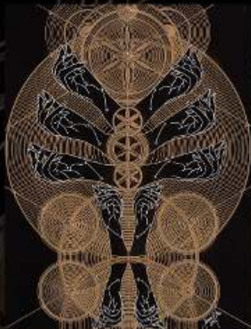
Manus Milaculorum 14