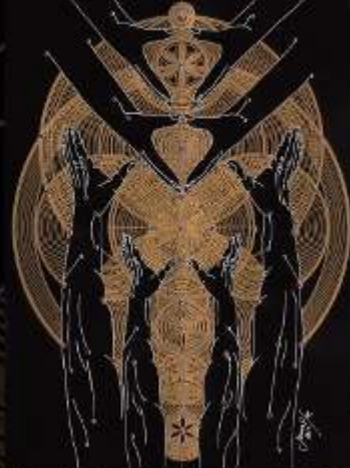
Manus Milacolorum 3