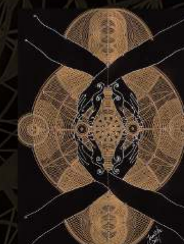
Manus Milaculorum 21