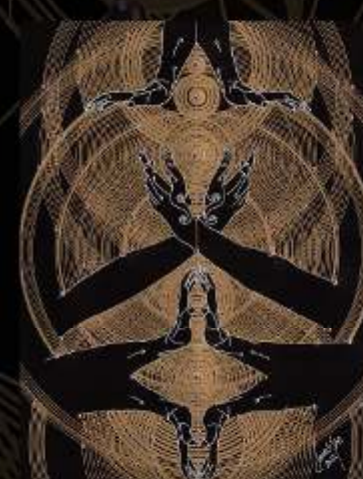
Manus Milaculorum 22