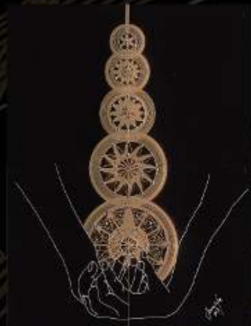
Manus Milaculorum 13