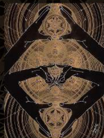
Manus Milaculorum 17