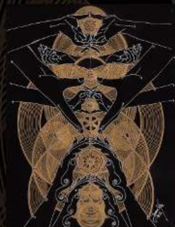
Manus Milacolorum 4