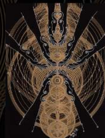
Manus Milacolorum 12