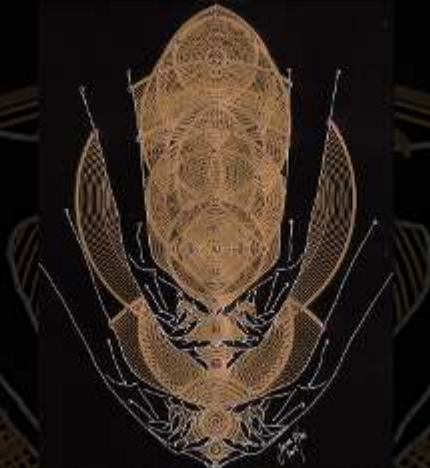
Manus Milacolorum 2