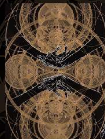
Manus Milaculorum 16