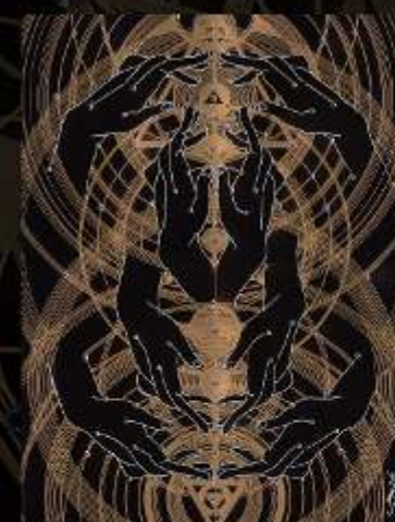
Manus Milaculorum 19