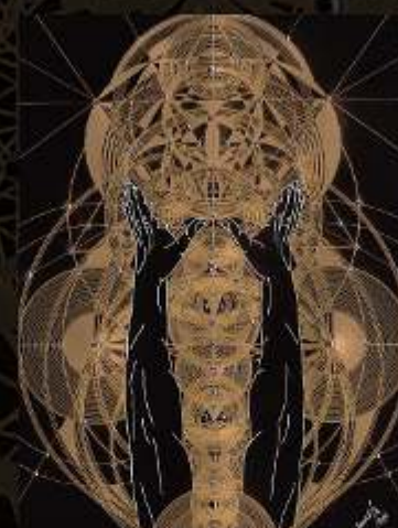
Manus Milaculorum 20