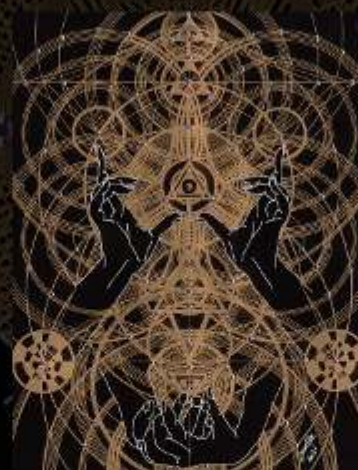
Manus Milacolorum 8