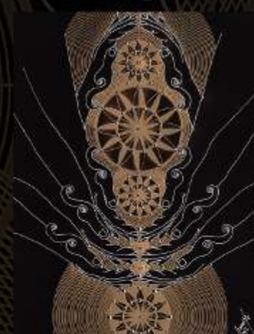
Manus Milacolorum 9