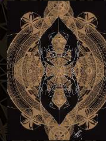
Manus Milaculorum 18